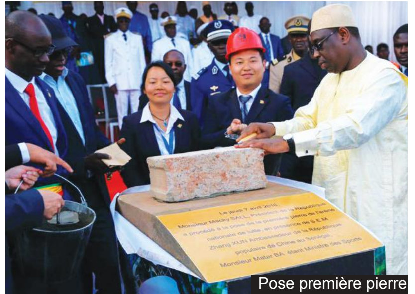
Pose première pierre

Ne serait-ce que pour les performances réalisées par ces sportifs qui ont contribué au rayonnement de notre pays, la construction d'une arène était devenue une exigence de taille. Au fil du temps ce sport s'est imposé