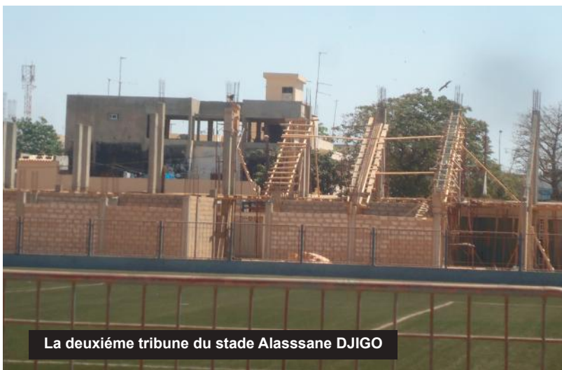
La deuxième tribune du stade Alassane DJIGO

L'Etat du Sénégal a injecté une enveloppe de un milliards 300 millions (1 300 000 000) de francs CFA pour la réfection de ce stade qui joue un rôle déterminant dans la pratique du sport au niveau du département de Pikine.