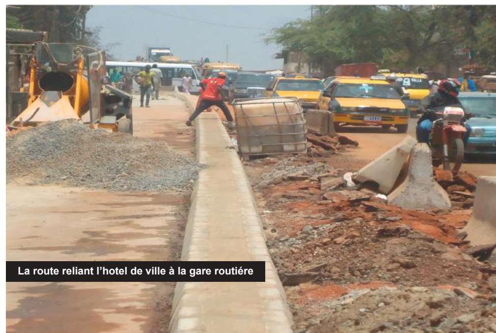
La route reliant l'hotel de ville à la gare routière

Plusieurs tronçons de Pikine vont donc être bitumés et la population doit désormais s'habituer au vrombissement des moteurs des engins qui vont être mis en marche à plein temps pour que d'ici peu de temps certaines pistes sablonneuses disparaissent pour céder la place au goudron. C'est pourquoi la CDE l'entreprise chargée