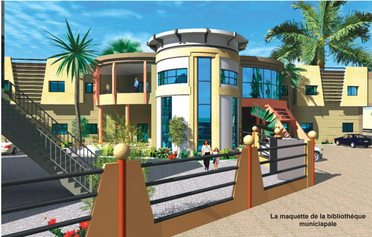
La maquette de la bibliothèque municipale

La culture prend une dimension essentielle dans la formation citoyenne et contribue à l'épanouissement de l'individu. La religion et les pratiques culturelles qui lui sont adjacentes rythment la vie de la population d'une Ville comme Pikine et participe à la régulation des comportements sociaux.