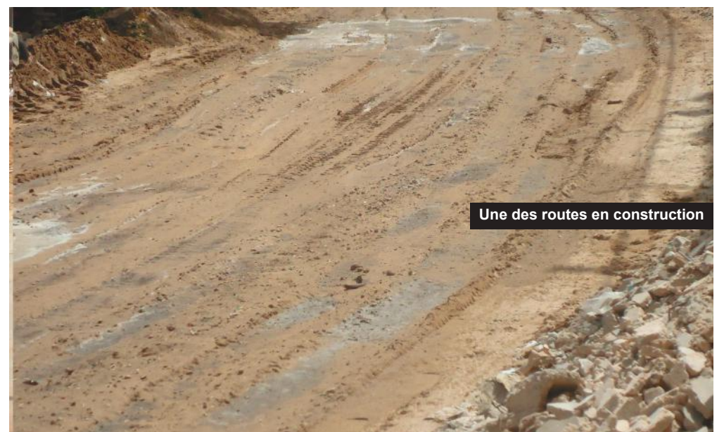
Une des routes en construction

Déjà la piste qui passe devant la Direction des Affaires Sociales, Sanitaires et Educatives (DASSE) et qui relie Tally Boumack à Tally Boubess sur 250 mètres de même que celle située derrière cette